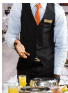
FORMATION 1 Le Service en salle